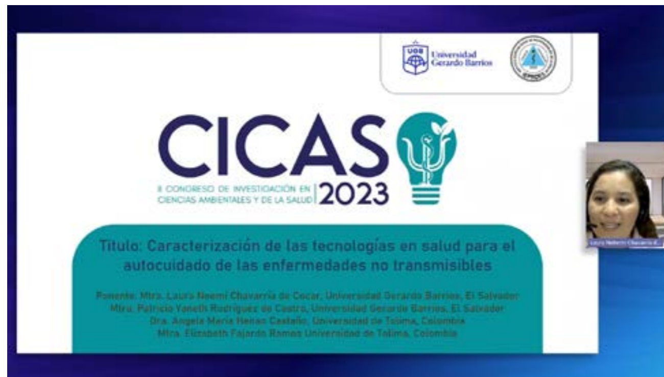
CICAS (Congreso de Investigación en Ciencias Ambientales y de la Salud 2023)

En noviembre de 2023 se realizaron 2 ediciones de video correspondientes a congresos en los que docentes del área de Investigación Desarrollo e Innovación participaron a través de ponencias sobre investigaciones realizadas: