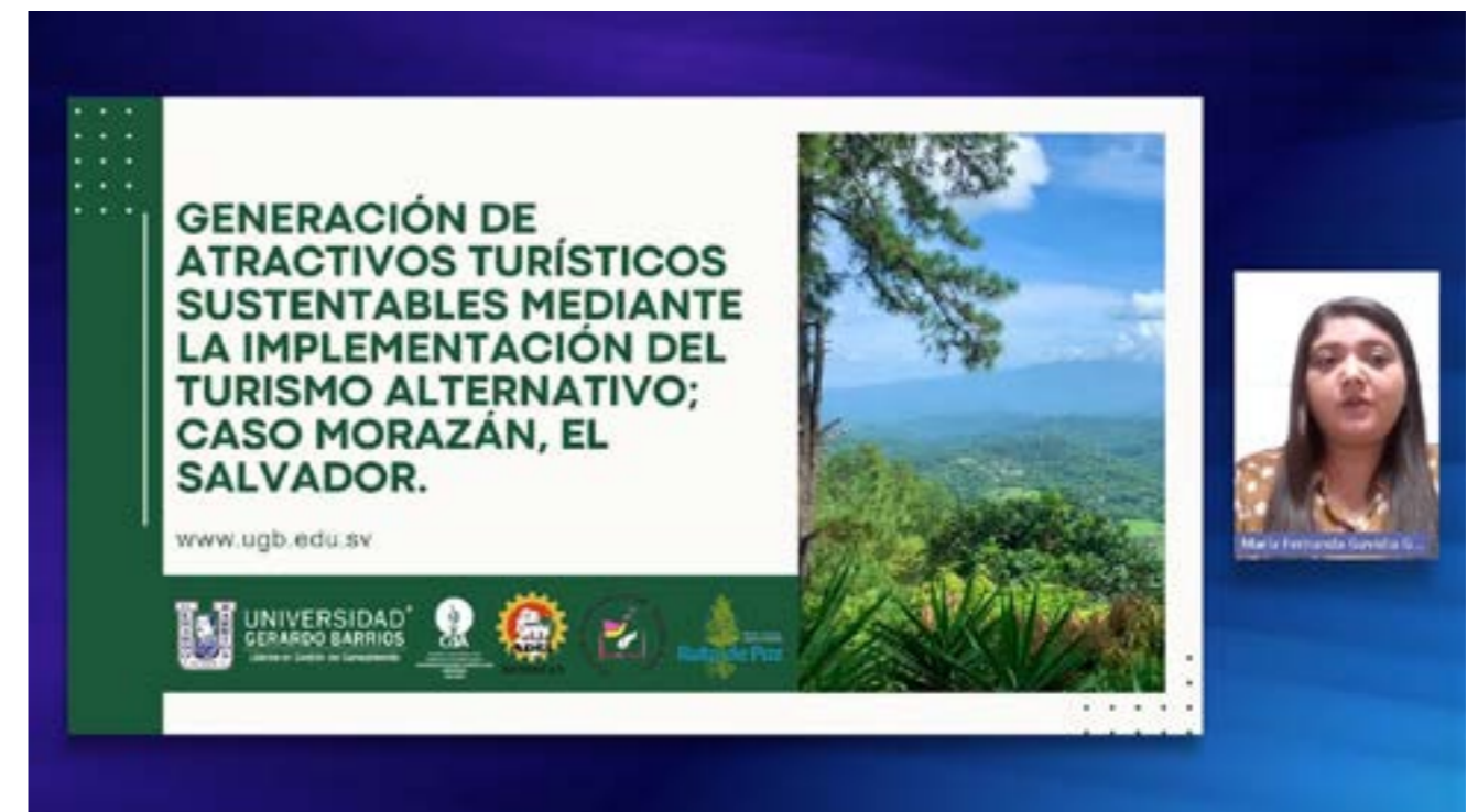
Congreso Iberoamericano sobre Turismo Sustentable 2023