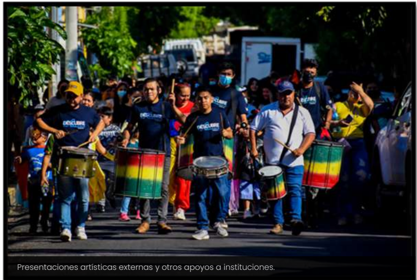
Presentaciones artísticas externas y otros apoyos a instituciones.