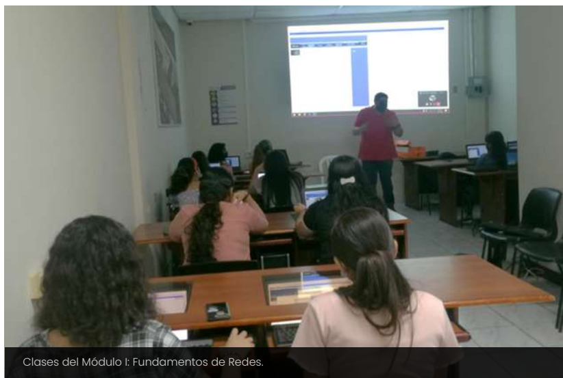
Clases del Módulo I: Fundamentos de Redes.