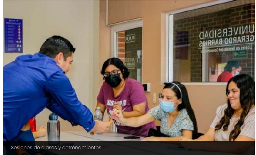
Sesiones de clases y entrenamientos.