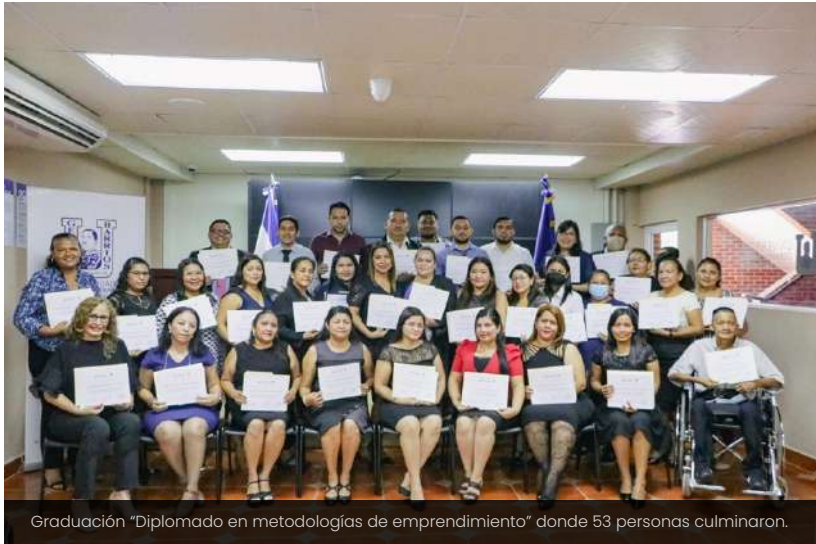
Graduación "Diplomado en metodologías de emprendimiento" donde 53 personas culminaron.