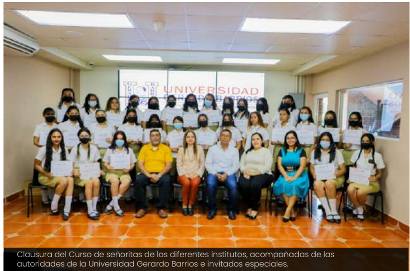
Clausura del Curso de señoritas de los diferentes institutos, acompañadas de las autoridades de la Universidad Gerardo Barrios e invitados especiales.