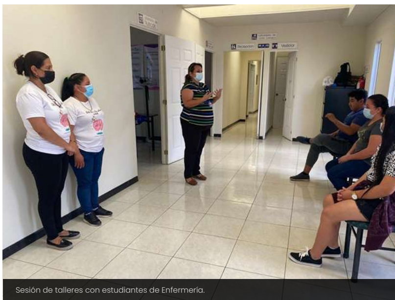
Sesión de talleres con estudiantes de Enfermería.