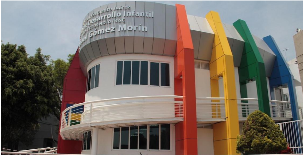
Ilustración 2 LOS CENDI MEXICO, Fuente: sopitas.com