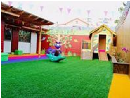
Ilustración 3Iniciativa Jardín infantil virtual en Chile

Esta iniciativa se basa a través de desarrollo de sus clases por plataformas virtuales, en el cual los docentes tienen la oportunidad de mostrarles dinámicas y cómo ambientar sus lugares de estudio en sus hogares, los padres de familia tienen un rol muy importante, en el ambiente de acuerdo a lo que indica el programa, en donde el niño se siente seguro y capaz de poder realizar sus actividades.